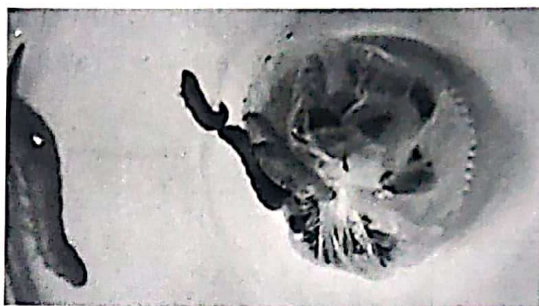
Hình 4. Sâu sáp có thể ăn rác thải nhựa [8].

polyethylene mà chúng thực sự đang ăn nhựa và phân hủy nhựa thành một hợp chất khác. Kết quả nghiên cứu cho thấy 100 con sâu nhai hết 92 mg nhựa polyethylene trong khoảng 12 giờ. Chúng phân tách nhựa thành ethylene glycol, một chất chống đông [8].