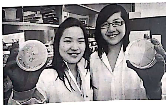
Hình 3. Hai sinh viên Canada tìm ra vi khuẩn ăn nhựa dưới đại dương [13].

Tháng 5 năm 2016, hai sinh viên tại Canada đã phát triển một chủng vi khuẩn mới với khả năng ăn nhựa dưới đại dương. Trước tiên, họ dùng một loại dung môi đặc biệt để hòa tan nhựa. Tiếp đến, họ dùng enzyme để phá vỡ cấu trúc của chúng. Cuối cùng, những hợp chất còn lại sẽ được vi khuẩn tiêu hóa hết. Quá trình phân hủy nhựa hoàn tất sau chưa đầy 24 tiếng [13].